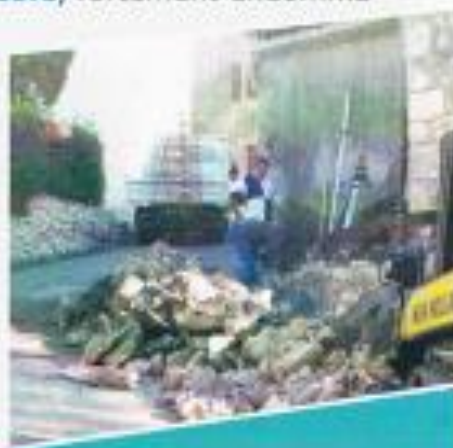
réfection de la cour de l'école

Lors de sa permanence trimestrielle, le Conseiller Général a pu constater l'étendue des dégâts et s'est investi sans ménagement pour que notre commune puisse bénéficier d'une subvention de 5 000 € pour réaliser ces travaux imprévus d'urgence et de sécurité. ■