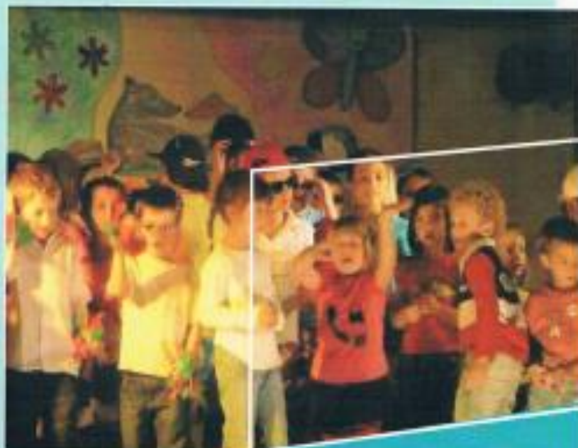
Fête des écoles - 22 juin 2011

■ tél. 04 66 83 23 78 - 06 12 42 54 53 ozsylvain@wanadoo.fr