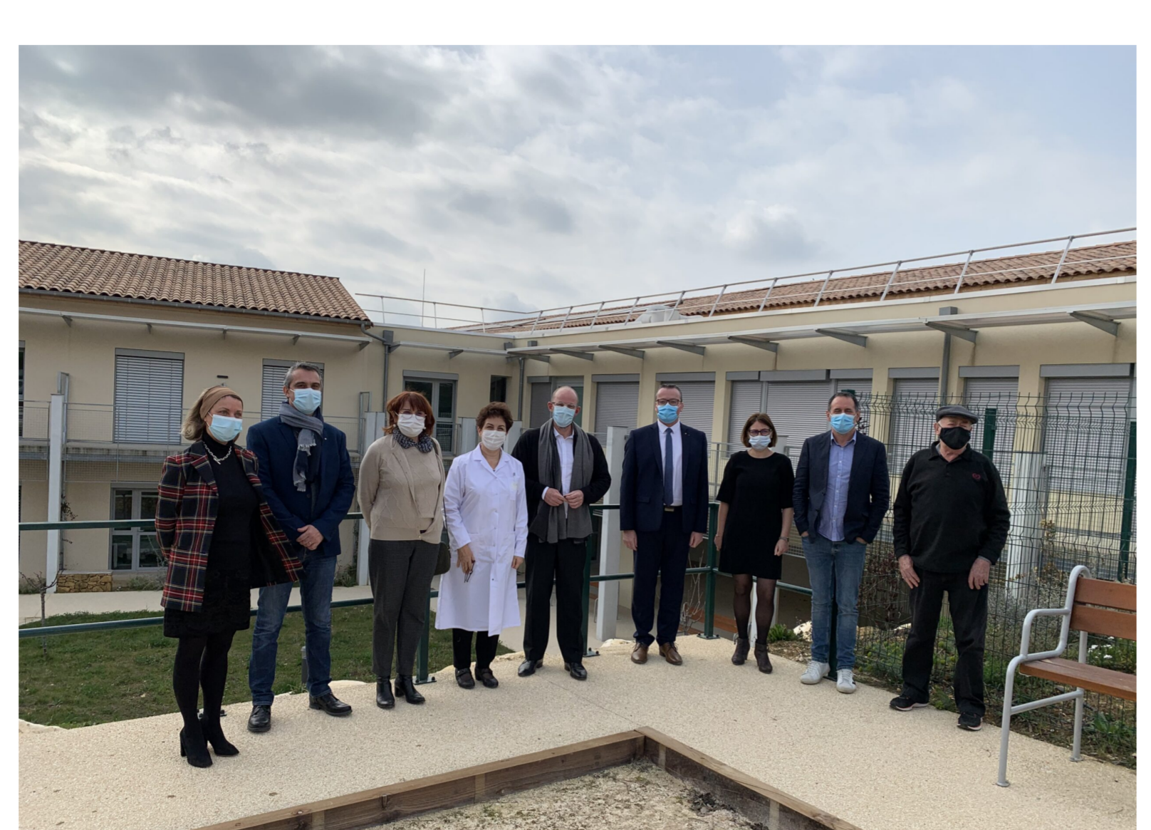
L'EHPAD Jean-Lasserre emploiera une cinquantaine de personnes lorsque le site aura atteint son plein potentiel, dès 2022.

Corentin Migoule 5 mars 2021 Dernière mise à jour: 5 mars 2021 0 492 2 minutes de lecture