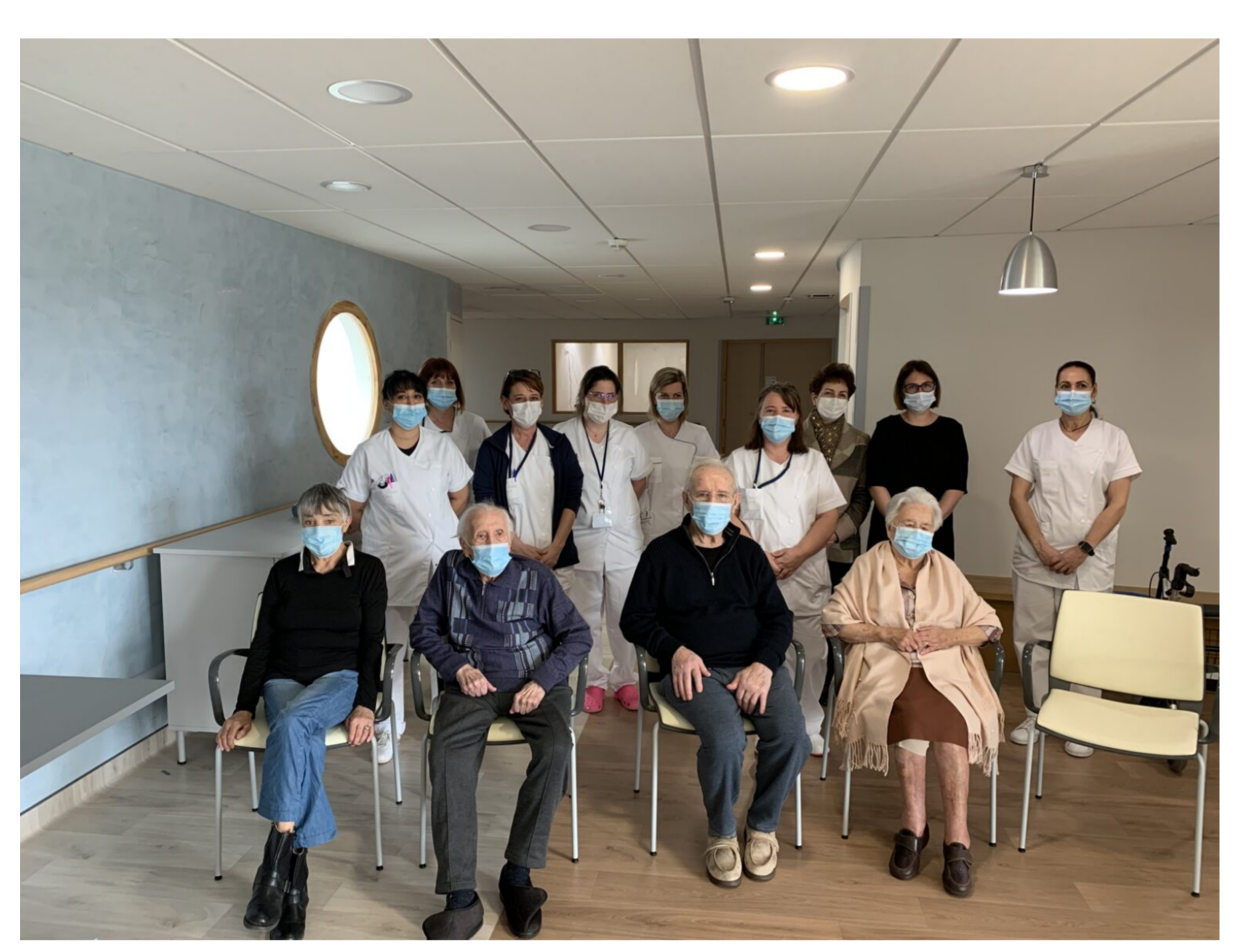
82% des résidents des EHPAD du centre hospitalier d'Uzès ont reçu les deux doses vaccinales.

Un petit voyage dans le temps initié par Cyril Ozil, maire d'Euzet-les-Bains, improvisé pour l'occasion professeur d'histoire, et qui n'a pas manqué de rappeler l'antériorité du projet : "Mes prédécesseurs y travaillaient depuis 2002 lorsque l'ex-communauté de communes de la région de Vézénobres avait l'intention de l'implanter à Deaux." Et d'ajouter : "Et puis par un soir d'hiver 2011, comme un cadeau de Noël, l'arrêté de création de l'établissement a enfin été signé."